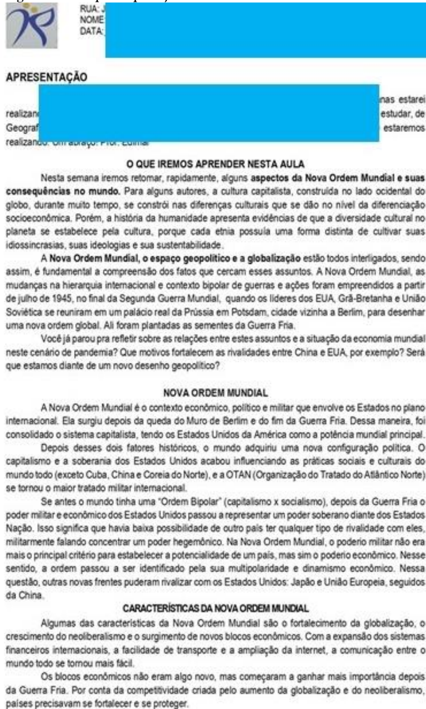
Figura 2– Exemplo de planejamento