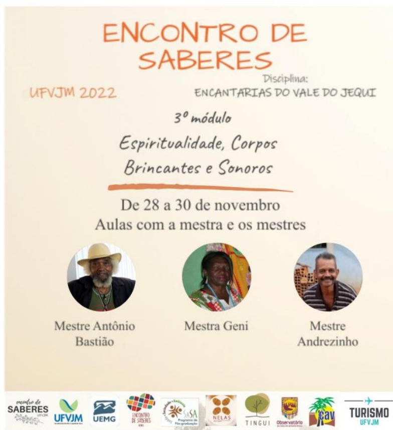
Imagem divulgação 3º Módulo